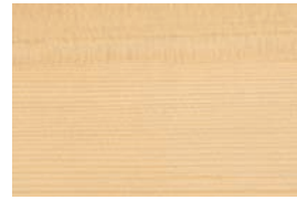
こうやまき (高野槇) 針

ヒノキ科の樹木。辺材は黄白色、心材は淡黄色。防腐性に優れ、最も耐水性のある木。松の仲間でも成分も香りも松に似ているが、ヒノキチオールを多く含み、防虫効果は松以上。耐水性に優れ、風呂桶・椅子などに使用されている。