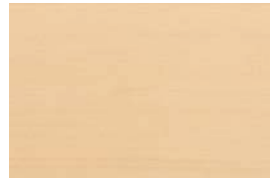
ヒバ (あすなろ) 針

ヒノキ科の樹木であるが、匂いの少ないことが特徴。辺材は白色、心材はくすんだ淡黄褐色で、材質が軽軟で切削やその他の加工が簡単で、湿気に強いことから、水桶やたらい・浴室用材などに使用されている。