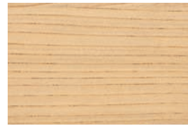
榎 (せん) 広

辺材は灰白色で、心材は帯黄紅褐色。硬く耐朽性にも優れ、木目が力強く美しい事から古くから日本国内で最良の広葉樹とされている。お盆、お椀などの漆器の材料として使用され、価値が高いとされている。