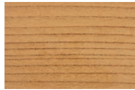
ケヤキ (欒) 広

焼杉は杉の表面をこがし、炭化状にすることで耐火性を向上させたもので、鍋敷きなど様々な製品に使用されている。