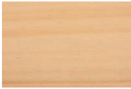
ひのき (檜・桧) 針

英語で針葉樹をソフトウッド、広葉樹をハードウッドと言うように、針葉樹は軽くて柔らかく、広葉樹は重くて硬いといわれています。(桐など一部広葉樹でも柔らかいなど例外もあります。)