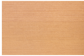
さわら (樺) 針

木曾檜は日本三大美林と呼ばれる。光沢がある白い木肌と独特の香りがあり、防虫効果もある。乾燥性が高く、柔らかく軽い。耐水性・耐久性に富み、強度が高い。まな板や風呂関係の道具に使用されている。