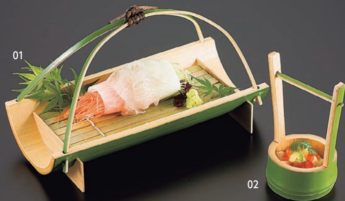
若竹柄付大皿 (ケス付) 16-091-01 (22379) 4,000円 約24.5×12×H13cm/ケス約19×7.5cm