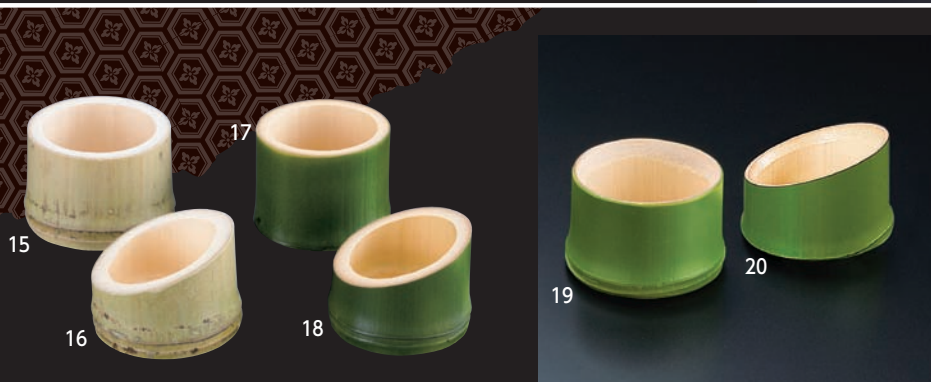
丸竹千代口 (無塗装)