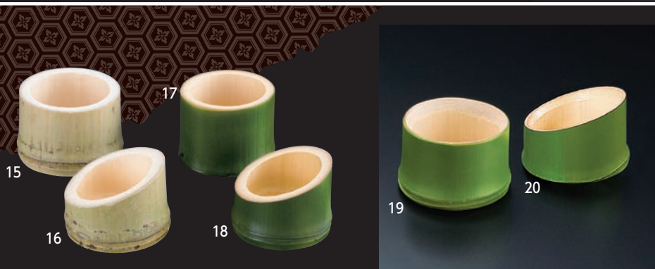
丸竹千代口 (無塗装) 16-091-15 (25740) 135円 約φ6×H4.5cm