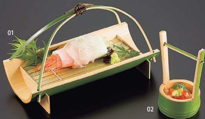
若竹柄付大皿 (ケス付)

16-091-01 (22379) 4,000円 約24.5×12×H13cm/ケス約19×7.5cm