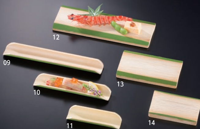
若竹細竹皿 16-091-09 (22597) 長 1,450円 約20×3.2×H1.5cm