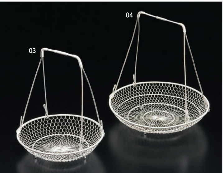
手提籠 シルバー 16-099-03 (24414) 小 5,400円 約φ13.5×H17(3.1)cm 16-099-04 (24413) 大 6,300円 約φ17×H18.5(3.5)cm