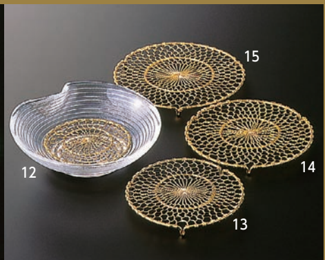
ステンレス目皿 16-099-05 (24820) 3寸 800円 約φ9×H1.2cm 16-099-06 (24821) 3.5寸 850円 約φ10.5×H1.2cm 16-099-07 (24822) 4寸 1,000円 約φ11.5×H1.2cm