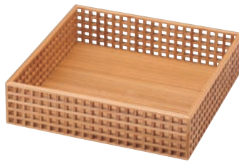
細目格子盛器 正角

16-134-02 (31156) 約21.2×21.2×H5.3cm/内寸約20×20×H4.7cm