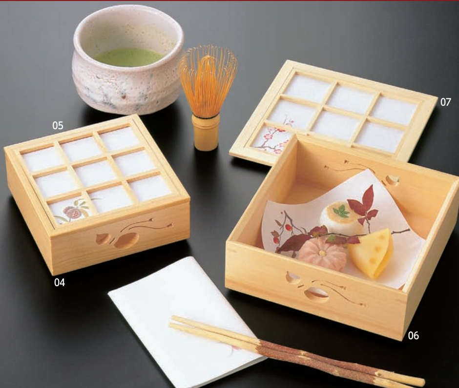
ひのき透かし料理箱(ひょうたん) (小) 積重

※材質：杉 ※ナチュラル仕上げ塗装付 ※杉は軽くやわらかい特性がございます。とても繊細な器ですので、取扱いにご注意ください。