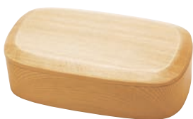
白木くりぬき料理箱 角丸 16-137-02 (27447) 3,800円 約18.2×10.4×H5.5cm/内高約H3.7cm ※ウレタン塗装