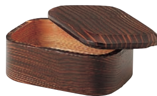
焼杉蓋付弁当 16-137-05 (25013) 5,300円 約17×12.5×H7cm 内寸約15.3×11×H4cm