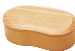
白木くりぬき料理箱 そら豆 16-137-03 (27448) 3,800円 約18.2×10.4×H5.5cm/内高約H3.7cm ※ウレタン塗装

*天然木のため、色・木目等にバラつきがございます。木目に一部黒い部分が出たり、樹液により、傷のように見える跡がある可能性があります。品質上の問題はございません。