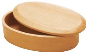
白木くりぬき料理箱 小判 16-137-01 (27446) 3,800円 約18.2×10.4×H5.5cm/内高約H3.7cm ※ウレタン塗装