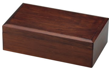
杉・古代色料理箱 受注 16-137-04 (27016) 5,000円 約21.2×12×H6.5cm 内寸約20×11×H4.5cm