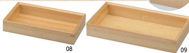
荒彫り料理箱 クリアー 16-137-08 (27572) 小 3,400円 約19.5×11×H3.8cm/内寸約18×9.5×H2.8cm 16-137-09 (27573) 大 4,300円 約25×13.4×H4.3cm/内寸約23.5×11.9×H3.3cm