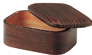
焼杉蓋付弁当 16-137-05 (25013) 5,300円 約17×12.5×H7cm 内寸約15.3×11×H4cm