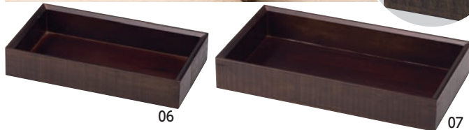
荒彫り料理箱 茶 16-137-06 (27570) 小 3,700円 約19.5×11×H3.8cm/内寸約18×9.5×H2.8cm 16-137-07 (27571) 大 4,700円 約25×13.4×H4.3cm/内寸約23.5×11.9×H3.3cm