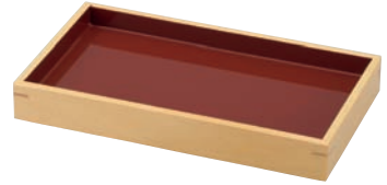
創・長角盛皿 内朱 積重 16-138-04 (38515) 3,100円 約22.7×13×H3cm/内寸約21.5×11.7×H1.5cm