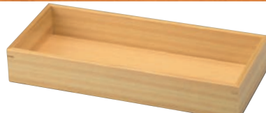
創・長角料理箱 深 積重 16-138-09 (38597) 3,600円 約28×12.3×H4.7cm/内寸約26.8×11.2×H4.1cm