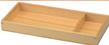
創・長角料理箱 浅(仕切板付) 積重 16-138-08 (38598) 3,450円 約28×12.3×H3.3cm/内寸約26.8×11.2×H2.7cm ※身・仕切板セット(仕切板は固定されておりません) ※金網・陶器は別売