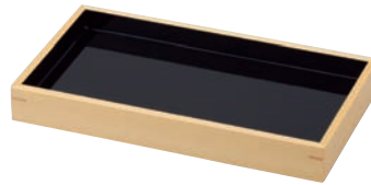
創・長角盛皿 内黒 積重 16-138-03 (38516) 3,100円 約22.7×13×H3cm/内寸約21.5×11.7×H1.5cm