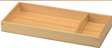
創・長角料理箱 浅(仕切板付) 積重 16-138-08 (38598) 3,450円 約28×12.3×H3.3cm/内寸約26.8×11.2×H2.7cm ※身・仕切板セット(仕切板は固定されておりません) ※金網・陶器は別売