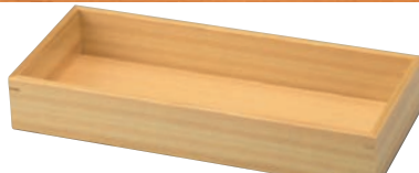
創・長角料理箱 深 積重 16-138-09 (38597) 3,600円 約28×12.3×H4.7cm/内寸約26.8×11.2×H4.1cm