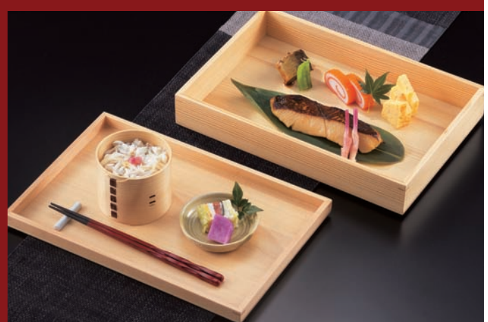
白木料理箱 二段トレイタイプ 積重 16-138-07 (10341) 6,250円 身: 約30.7×20.7×H4.7cm (内高約H4.2cm) 蓋: 約30.7×20.7×H2cm (内高約H1.5cm) 内寸約29.3×19.4cm ※身・蓋セット