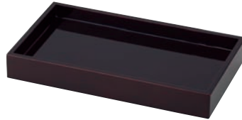
創・長角盛皿 溜塗 積重 16-138-02 (38517) 3,000円 約22.7×13×H3cm/内寸約21.5×11.7×H1.5cm