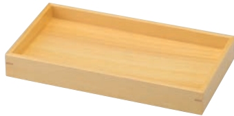
創・長角盛皿 クリアー 積重 16-138-01 (38514) 2,700円 約22.7×13×H3cm/内寸約21.5×11.7×H1.5cm ※竹スダレ(16-138-12)別売