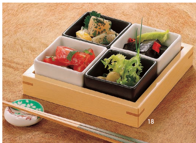
白木市松専用トレイ

16-149-06 (26606) ヒワ吹 190円 16-149-10 (26726) 黒マット 180円 16-149-07 (26605) 黄吹 190円 16-149-11 (26725) 白 170円 16-149-08 (26604) ピンク吹 190円 16-149-12 (26618) 吹墨 190円 16-149-09 (26615) コバルト吹 190円 約5.7×5.7×H3.7cm ※マット=ツヤ消し