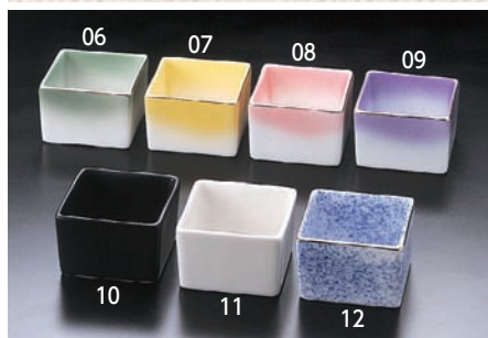
陶器・角型珍味入

16-149-05 (16180) 1,200円 約18.8×7×H2.5cm/内寸約17.5×5.8×H1.8cm ※陶器は別売です。下記角型珍味入からお選びください。