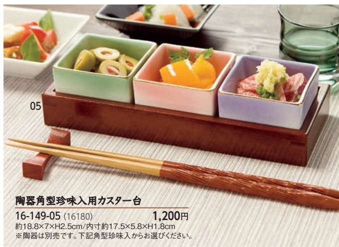
陶器角型珍味入用カスター台

16-149-14 (26460) 黒 620円 約8×8×H2.3cm 16-149-15 (26461) 白 620円 約8×8×H2.3cm 16-149-16 (26462) ピンク 620円 約8×8×H2.3cm 16-149-17 (26463) ブルー 620円 約8×8×H2.3cm