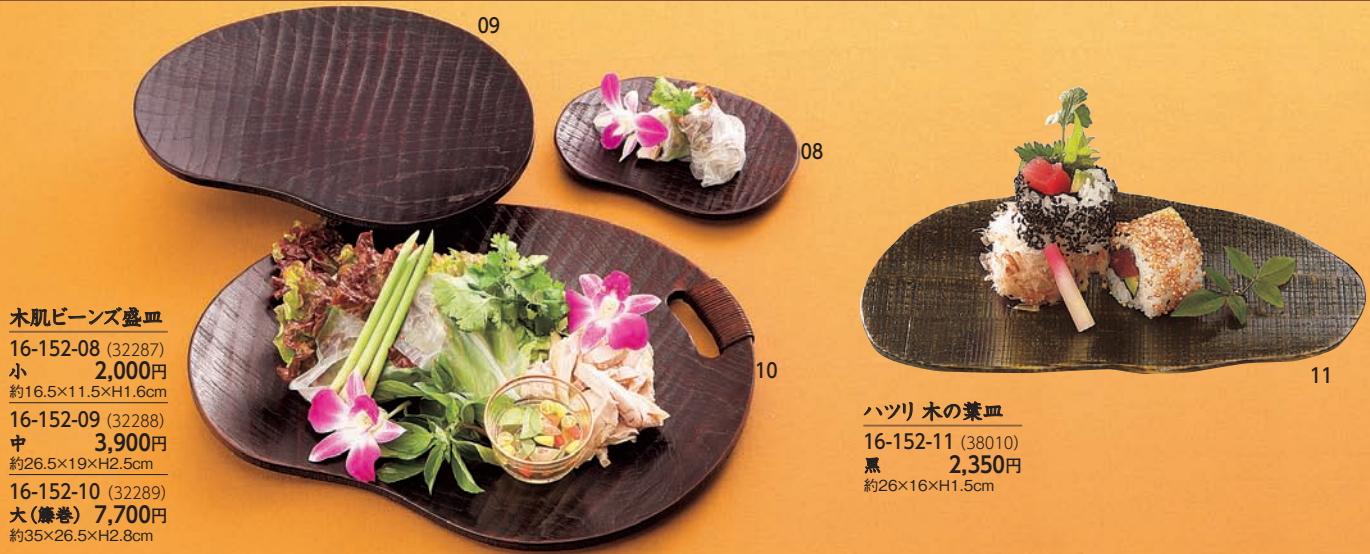
木肌ビーンズ盛皿

16-152-08 (32287) 小 2,000円 約16.5×11.5×H1.6cm