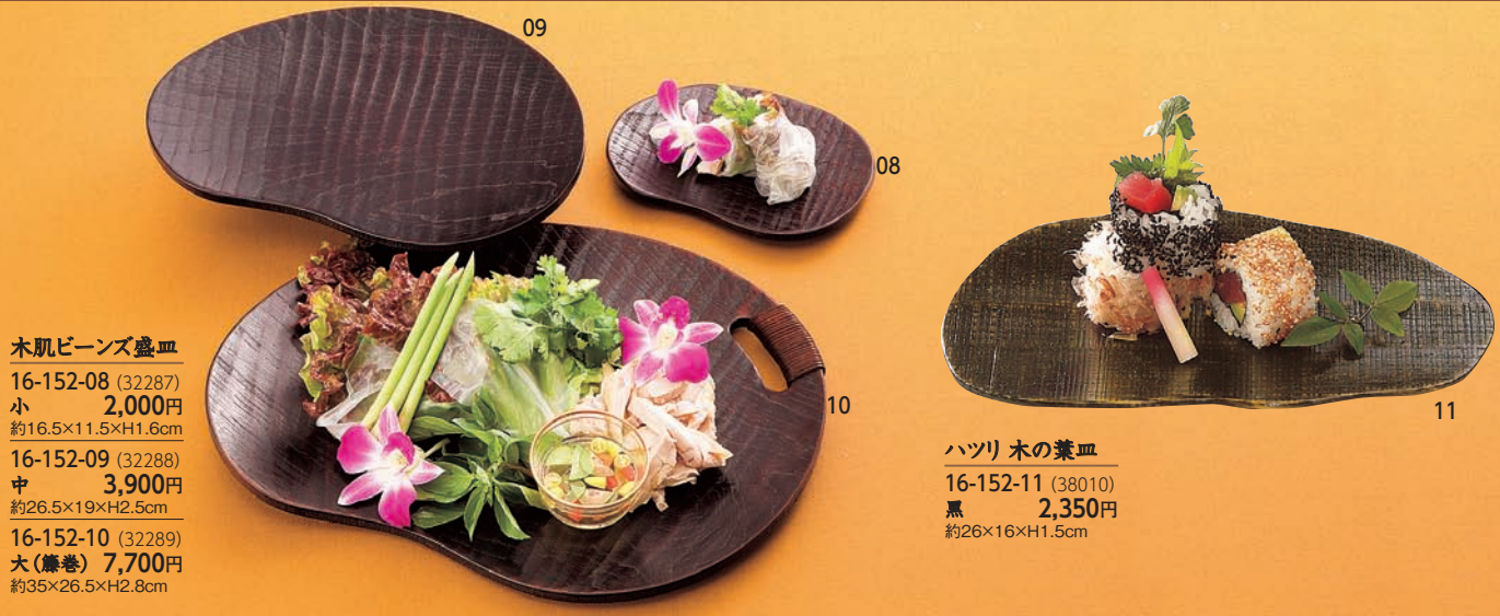
木肌ビーンズ盛皿

16-152-08 (32287) 小 2,000円 約16.5×11.5×H1.6cm