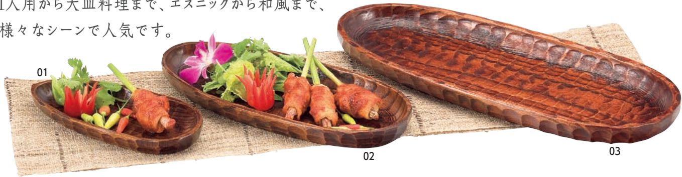
舟型ノミ目トレイ

16-152-01 (32194) 小 2,500円 約21×9.5×H2.3cm