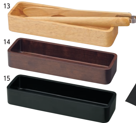
◆木製カトラリーサーバーにトングをセットできます。(木製アームトング L) SC 木製カトラリーサーバー 積重 16-188-13 (15258) ナチュラル 2,200円 16-188-14 (15257) ブラウン 2,200円 16-188-15 (08363) ブラック 2,200円 約26.4×8.1×H4.6cm/内寸約25×6.7×H3.7cm ※トング別売