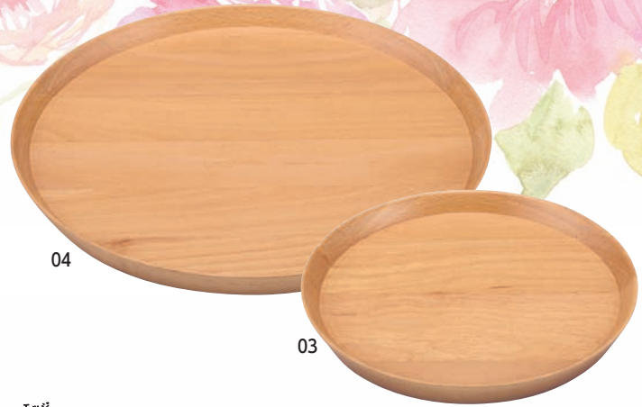
エッジ Edgeプレート 積重 16-188-03 (32066) 18cm 1,800円 約φ18×H2cm 16-188-04 (32067) 27cm 3,200円 約φ27×H2cm ※材質：ビーチ/ウレタン塗装