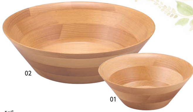
エッジ Edgeボウル 積重 16-188-01 (32064) 15cm 1,600円 約φ15×H5.7cm 16-188-02 (32065) 24cm 2,850円 約φ24×H7cm ※材質：ビーチ/ウレタン塗装