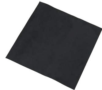
ノンスリップ保護シート(グレー) 16-188-16 (31057) 350円 約20×20×t0.2cm ※置いた陶器などのすべりを止める高密度スポンジです。 ※ご希望のサイズ・形状にカットしてご使用いただけます。 ※材質：エチレン酢酸ビニール樹脂