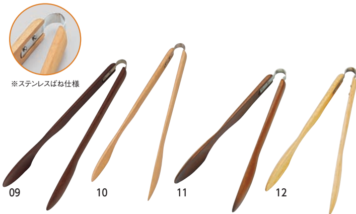
木製アームトング L 16-188-09 (45370) ブラウン 1,480円 約3.7×L30cm 16-188-10 (45371) ナチュラル 1,480円 約3.7×L30cm 木製アームトング S 16-188-11 (45388) ブラウン 1,300円 約3.7×L24.5cm 16-188-12 (45389) ナチュラル 1,300円 約3.7×L24.5cm