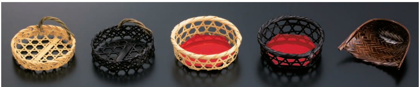
六ツ目かざら付筥