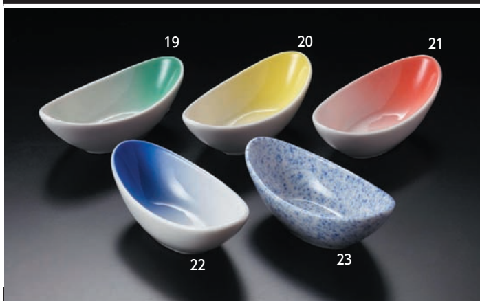
舟型珍味入 16-199-19 (26780) ヒワ吹 160円 16-199-22 (26783) ブルー吹 160円 16-199-20 (26781) 黄吹 160円 16-199-23 (26784) 吹墨 160円 16-199-21 (26782) レッド吹 160円 約8.9×4.3×H3cm ※輸入陶器(小箱10ヶ入)