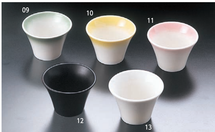
陶器・反り丸型珍味入 16-199-09 (26722) ヒワ吹 150円 16-199-12 (26723) 黒マット 150円 16-199-10 (26721) 黄吹 150円 16-199-13 (26724) 白 140円 16-199-11 (26720) ピンク吹 150円 約φ5.7×H4cm ※輸入陶器(小箱10ヶ入) ※マット=ツヤ消し