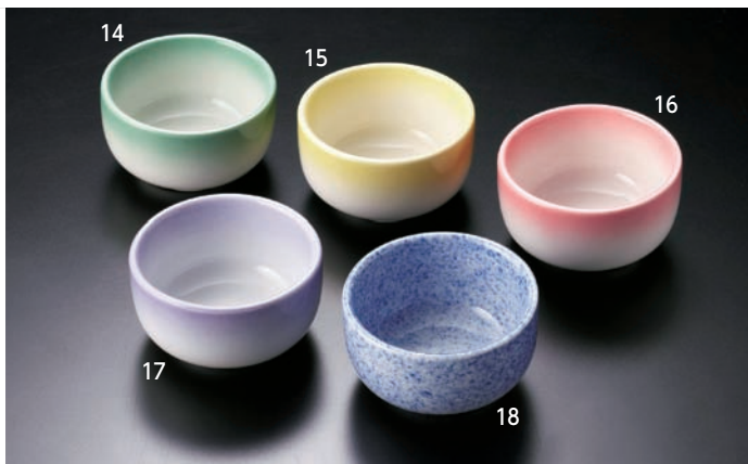
お碗型珍味入 16-199-14 (26740) ヒワ吹 160円 16-199-17 (26743) コバルト吹 160円 16-199-15 (26741) 黄吹 160円 16-199-18 (26744) 吹墨 160円 16-199-16 (26742) ピンク吹 160円 約φ6.2×H3.5cm ※輸入陶器(小箱10ヶ入)