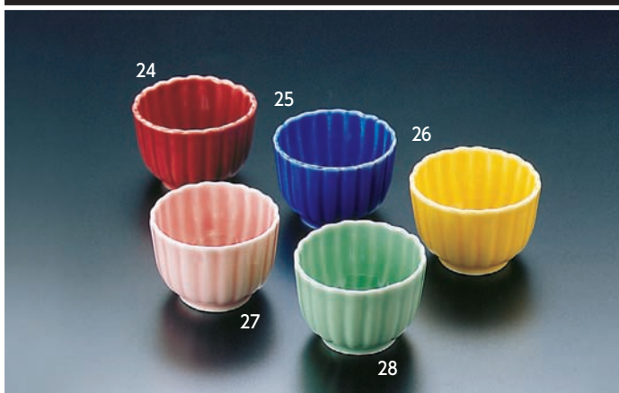
菊珍味入 16-199-24 (26498) マロン 200円 16-199-27 (26499) ピンク 200円 16-199-25 (26592) ブルー 200円 16-199-28 (26593) グリーン 200円 16-199-26 (26594) イエロー 200円 約φ4.8×H3.5cm ※輸入陶器(小箱10ヶ入)