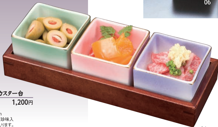
陶器角型珍味入用カスター台 16-199-01 (16180) 1,200円 約18.8×7×H2.5cm 内寸約17.5×5.8×H1.8cm ※陶器別売 ※陶器・角型珍味入 (16-199-02~08)が3個入ります。