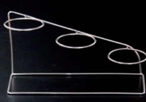
ステップリングベース

16-217-02 (29001) 1,150円 約17.6×6.7×H6.5cm(リング内径 約φ4.5cm) ※器別売 ※ステンレス製