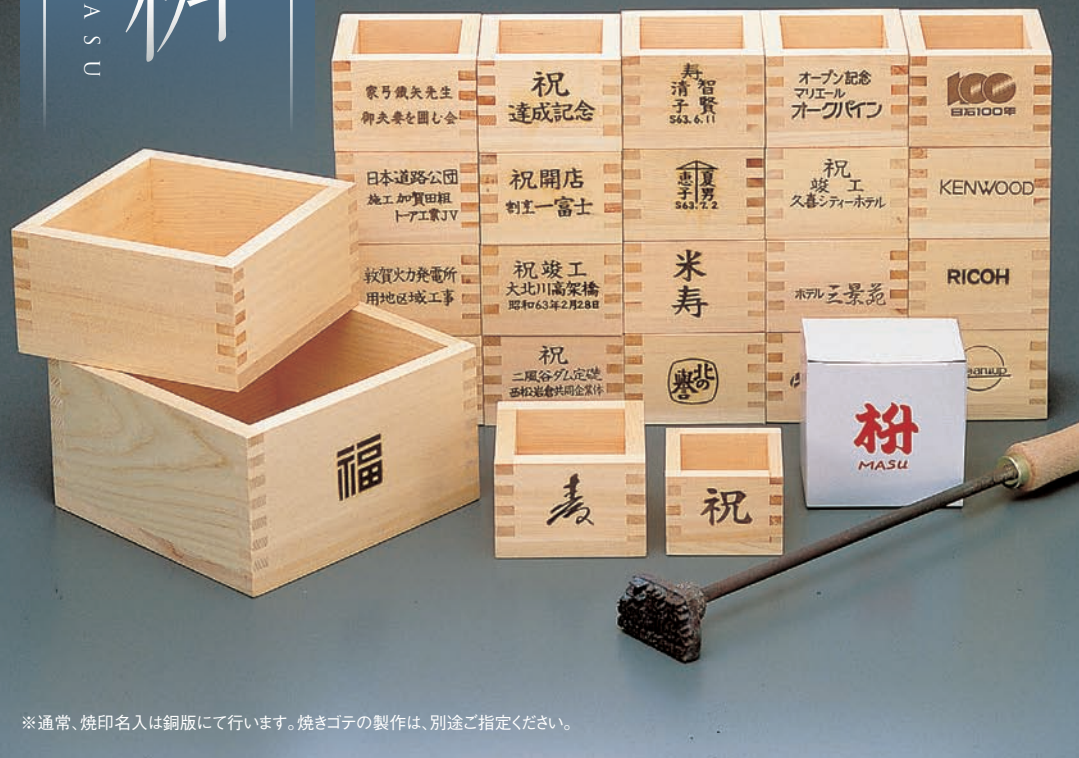
※通常、焼印名入は銅版にて行います。焼きゴテの製作は、別途ご指定ください。