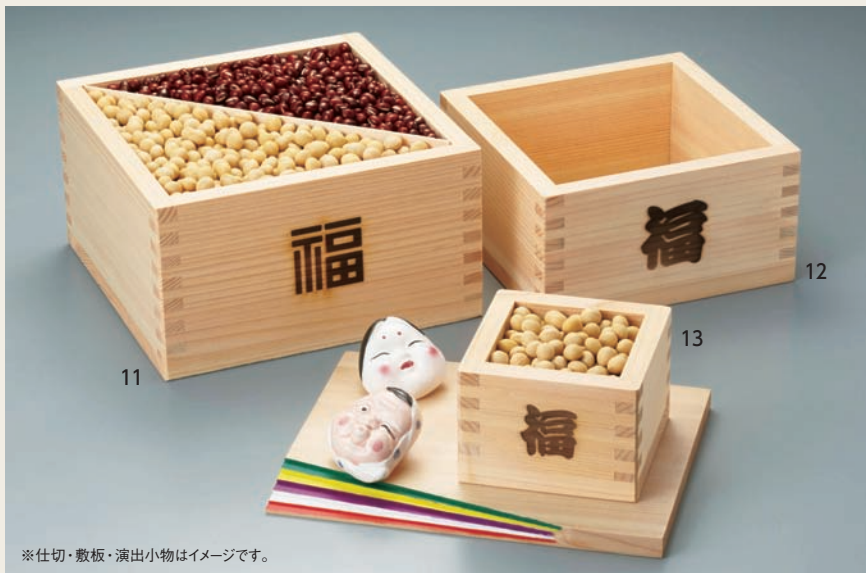
※仕切・敷板・演出小物はイメージです。

16-223-10 (12000) 5勺枺/いのみ用(「銘木ひのき」) 60円 ※単箱は組立前の状態での出荷となります。