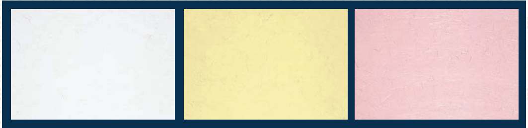
16-262-11 (68101) 白雲竜・無地 2,000円 (1枚当り20円)