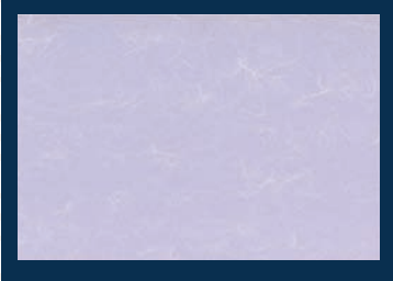
16-262-01 (65056) 尺5 藤色 5,500円 (1枚当り55円)