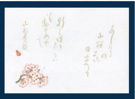
16-264-02 (65064) 桜(3月~4月)