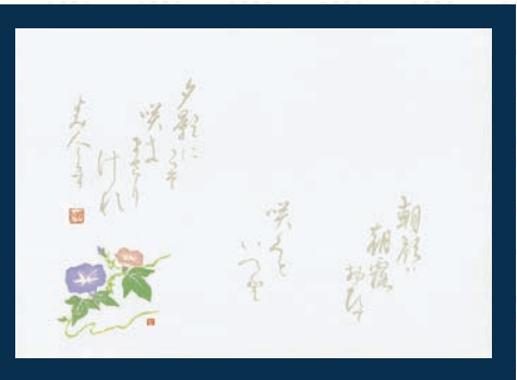
16-264-05 (64532) 朝顔(7月~8月)