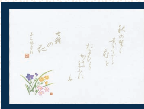
16-264-06 (64533) 秋草(8月~9月)