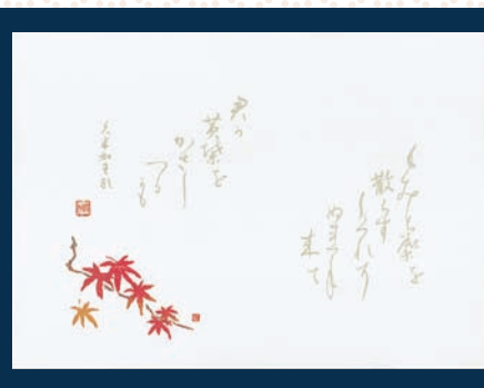
16-264-07 (64534) 紅葉(10月~11月)