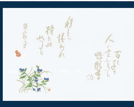
16-264-04 (65065) 露草(6月~8月)