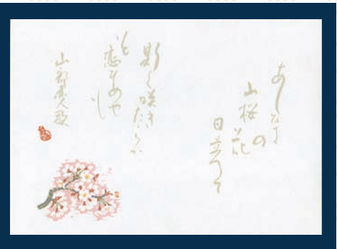
16-264-02 (65064) 桜(3月~4月)