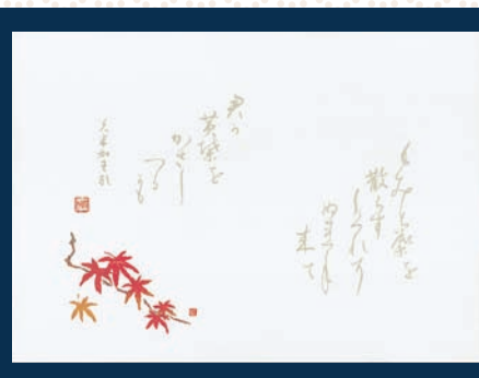
16-264-07 (64534) 紅葉(10月~11月)