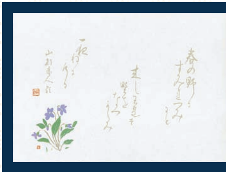
16-264-03 (64531) すみれ(4月~5月)