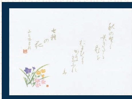
16-264-06 (64533) 秋草(8月~9月)