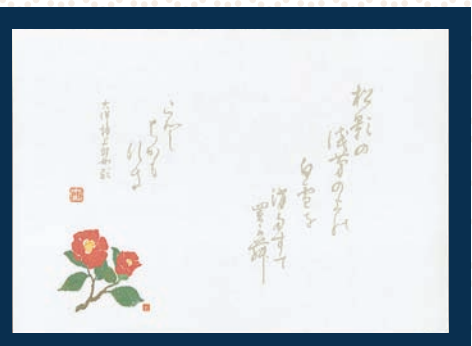
16-264-08 (64535) 椿(11月~2月)