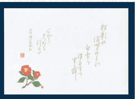
16-264-08 (64535) 椿(11月~2月)