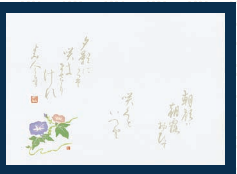
16-264-05 (64532) 朝顔(7月~8月)