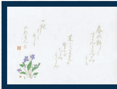
16-264-03 (64531) すみれ(4月~5月)