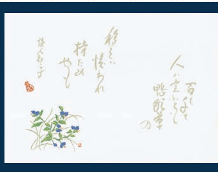
16-264-04 (65065) 露草(6月~8月)