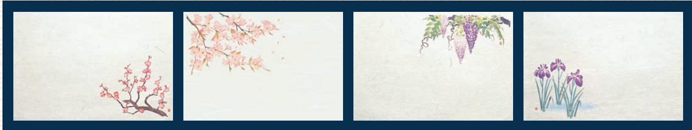
16-267-01 (64470) 梅 (1月～3月)