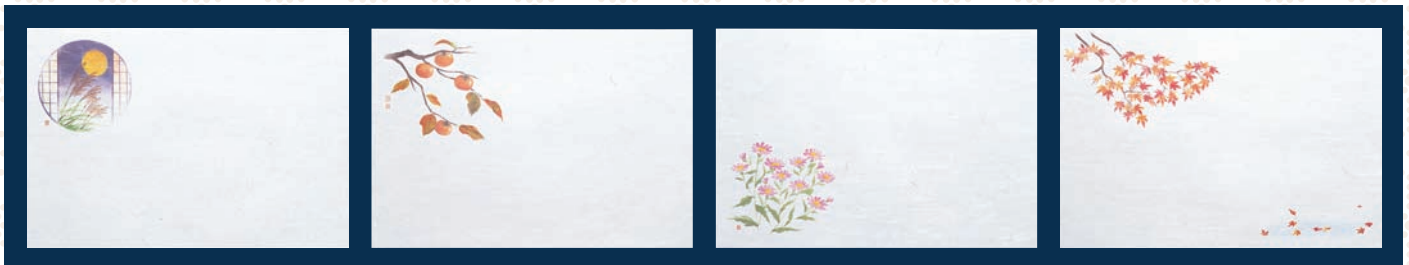
16-268-11 (65635) お月見(9月~10月)