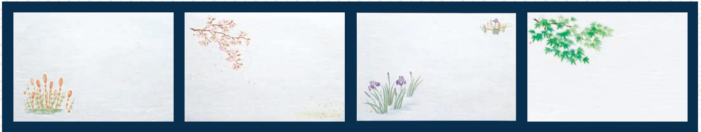
16-268-03 (65040) つくし(2月~4月)