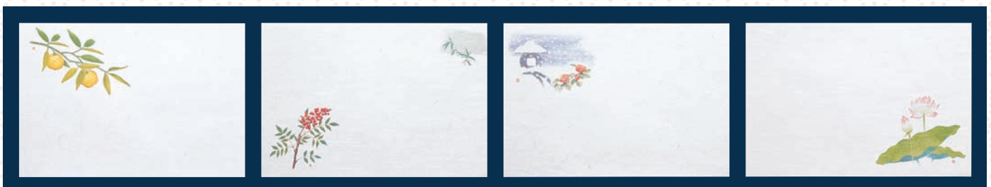
16-268-15 (65051) 柚子(10月~12月)