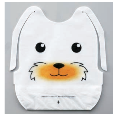
16-276-11 (64628) こいぬ

※材質：ポリエチレン不織布 ※下部をひっくり返すと、ポケットになり、食べこぼしをキャッチできます。