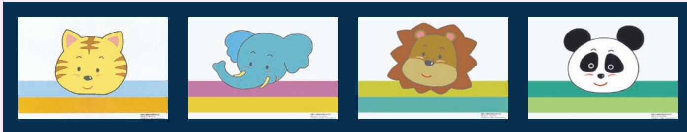
16-276-04 (65083) ねこ