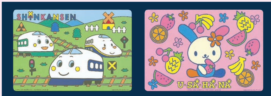
16-276-08 (64360) SHINKANSEN