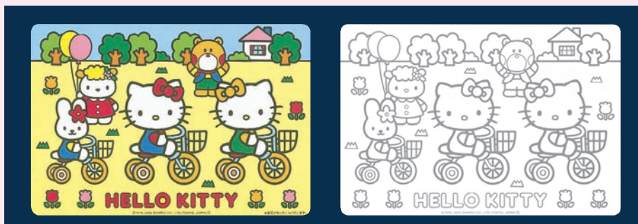
16-276-10 (64361) HELLO KITTY