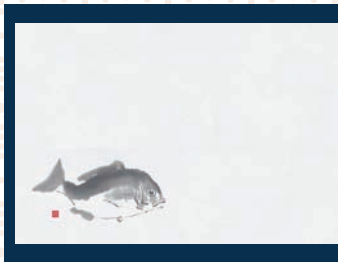
16-277-01 (64857) たい(鯛)