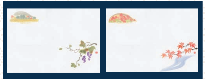
16-277-12 (64966) 山ぶどう(9月~10月)