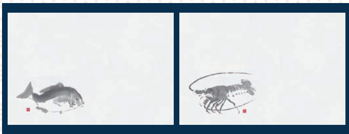
16-277-01 (64857) たい(鯛)