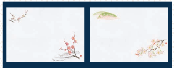
16-277-08 (64961) 梅(1月~3月)