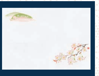
16-277-09 (64962) 桜(3月~4月)