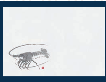
16-277-02 (64858) えび(海老)