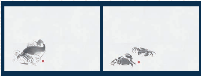
16-277-05 (64970) おこぜ(虎魚)