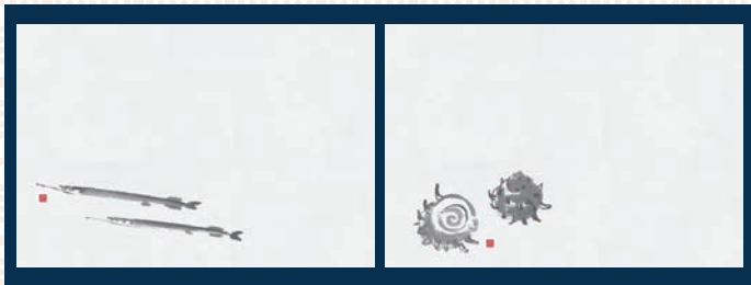
16-277-03 (64971) さより(細魚)