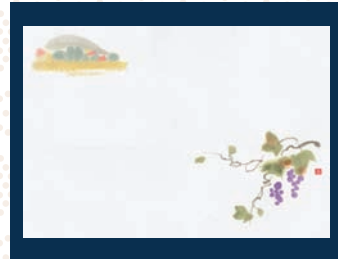
16-277-12 (64966) 山ぶどう(9月~10月)