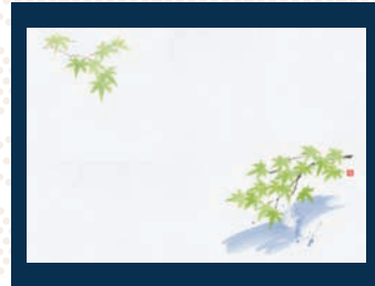
16-277-10 (64963) 青もみじ(4月~8月)