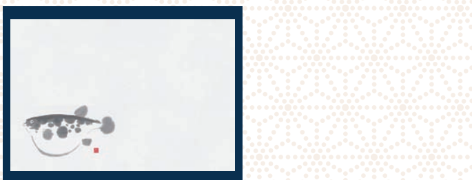
16-277-07 (64862) ふぐ(河豚)