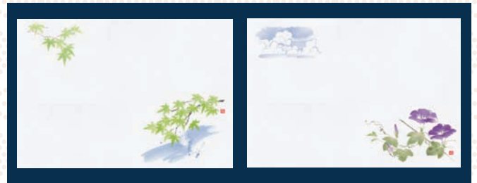
16-277-10 (64963) 青もみじ(4月~8月)