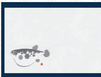
16-277-07 (64862) ふぐ(河豚)