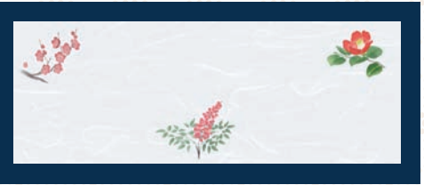
16-280-04 (66463) 冬(梅、南天、椿)