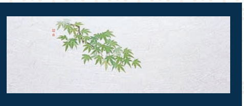
16-280-07 (68305) 青もみじ(4月~8月)