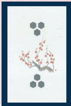
※上記が商品の出荷状態です。