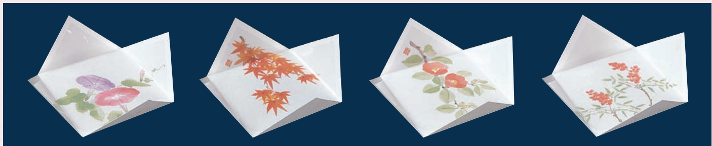
16-304-05 (65594) あさがお(7月~8月)