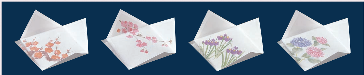
16-304-01 (65590) うめ(1月~3月)