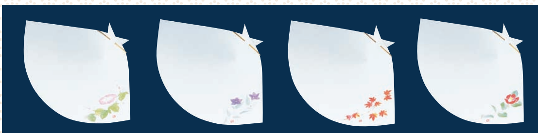
16-315-14 (66035) 朝顔(7月~8月)