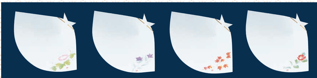
16-315-14 (66035) 朝顔(7月~8月)