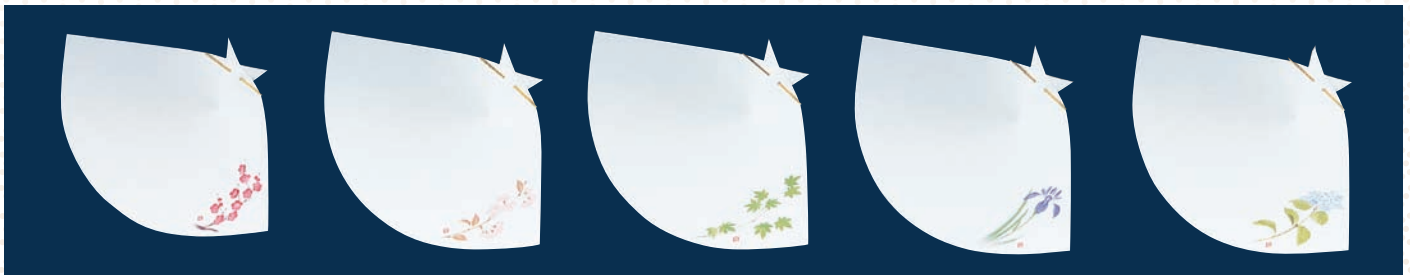
16-315-09 (66030) 梅(1月~3月)