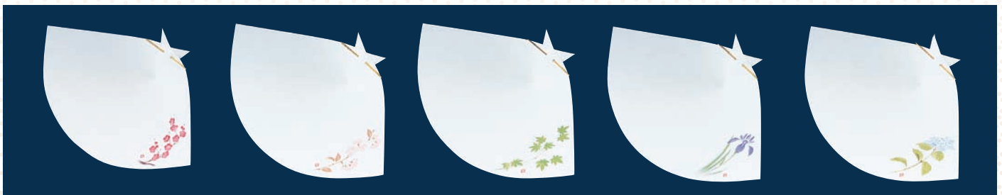
16-315-09 (66030) 梅(1月~3月)