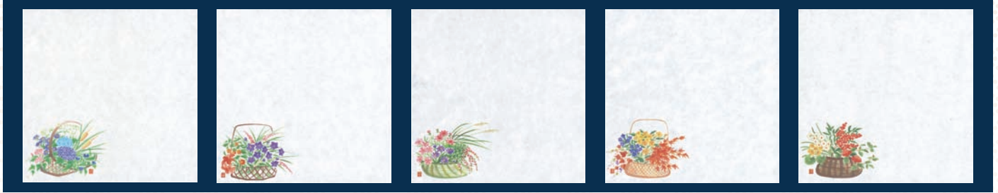
16-315-04 (65553) 夏(6月~8月)