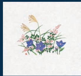
16-317-06 (64885) 秋草 (8月~9月)