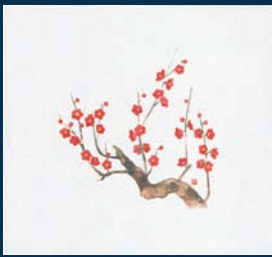
16-317-01 (64881) 梅 (1月~3月)