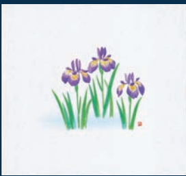
16-317-03 (64883) 菖蒲 (4月~5月)