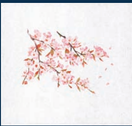
16-317-02 (64882) 桜 (3月~4月)