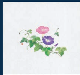
16-317-05 (64884) 朝顔 (7月~8月)