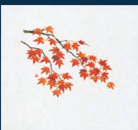
16-317-07 (64886) 紅葉 (10月~11月)