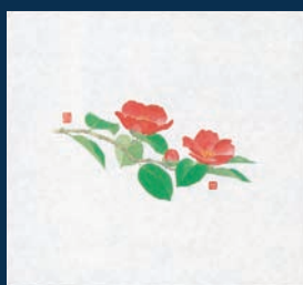
16-317-08 (65499) 椿 (11月~2月)