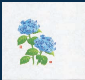
16-317-04 (65496) 紫陽花 (6月~7月)