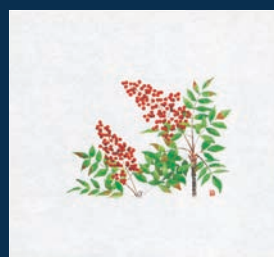
16-317-09 (64887) 南天 (12月~1月)