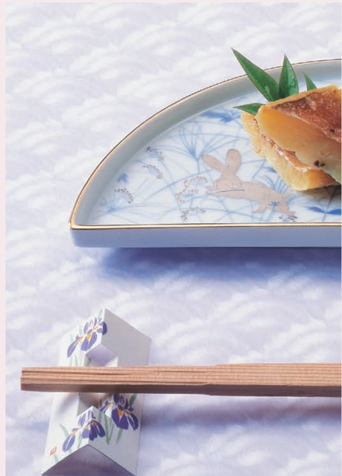
16-326-15 (65608) なんてん (12月~1月)