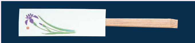
16-326-03 (65472) 菫 (4月~5月)