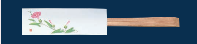
16-326-04 (65475) 昼顔 (7月~8月)