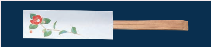
16-326-06 (65478) 椿 (11月~2月)