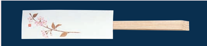
16-326-02 (65471) 桜 (3月~4月)