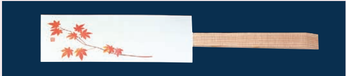
16-326-05 (65477) 紅葉 (10月~11月)