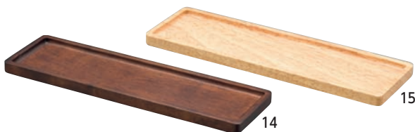
SC 木製スパイストレイ S