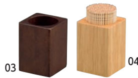
SC 木製ピックスタンド