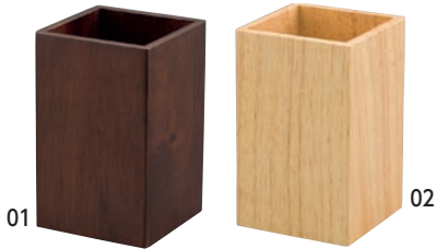
SC 木製カトラリースタンド