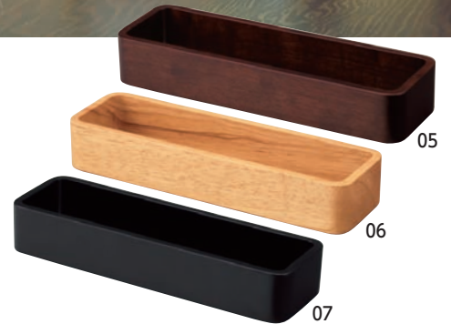
SC 木製カトラリーサーバー