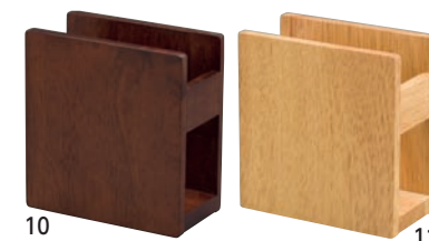
SC 木製ナプキンスタンド