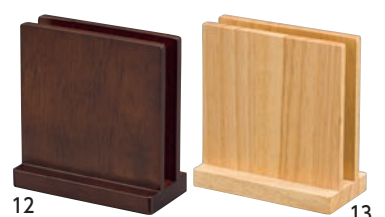
SC 木製メニュースタンド