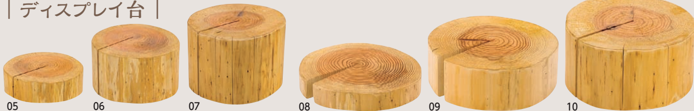
国産杉・丸太ディスプレイ台 小径