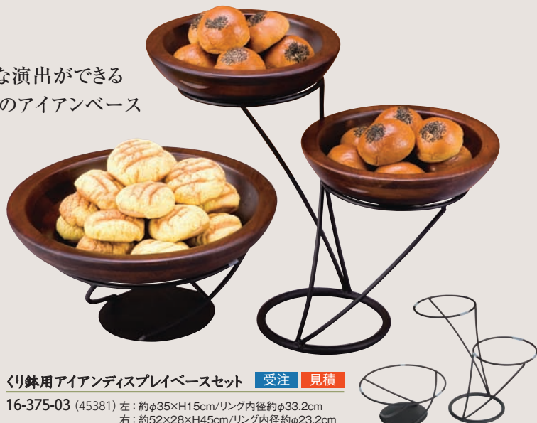
くり鉢用アイアンディスプレイベースセット