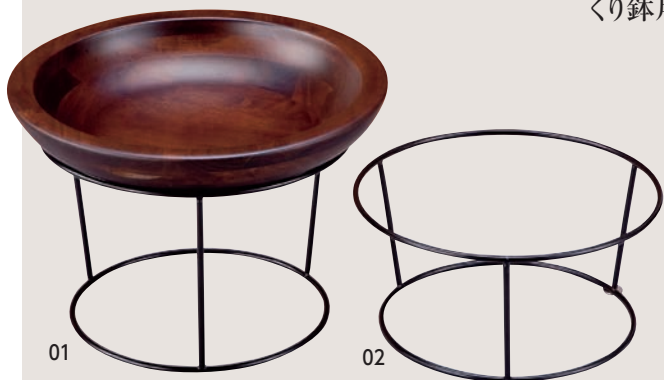
丸型アイアンスタンド