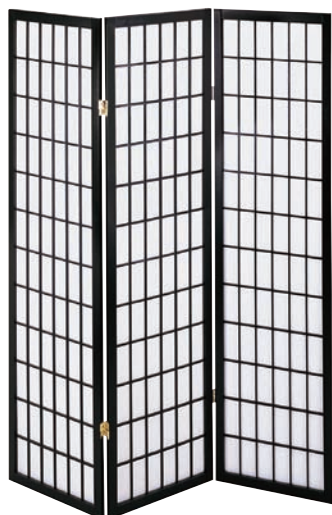
和風衝立3連 こだま 16-423-01 (58638) 16,000円 約45×2×H150cm×3枚 ※折り畳み時：約45×150×t6.5cm ※幕部：不織布