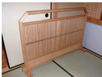
和風衝立(桐) 組立 16-423-07 (51234) 27,300円 W900 約90×29.5×H101cm 16-423-08 (51235) 38,800円 W1200 約120×29.5×H101cm