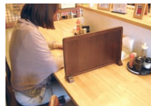
ミニ衝立 16-423-09 (56581) 8,500円 ブラウン 約45×8×H28cm 16-423-10 (56582) 8,500円 ライトブラウン 約45×8×H28cm 16-423-11 (56583) 8,000円 クリアー 約45×8×H28cm 材質：桐 ※ウレタン塗装