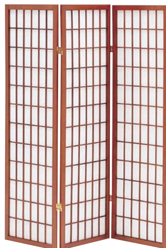
和風衝立3連 ひかり 16-423-02 (58639) 16,000円 約45×2×H150cm×3枚 ※折り畳み時：約45×150×t6.5cm ※幕部：不織布