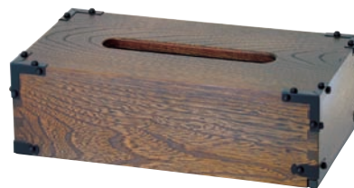
SI ティッシュボックス 元禄 16-431-02 (50647) 9,800円 約28×15.5×H9cm