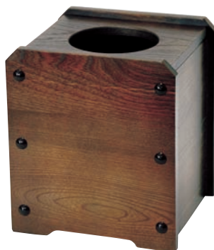
SI くず箱 大 元禄 16-431-04 (50650) 10,000円 約19.3×17.4×H22cm