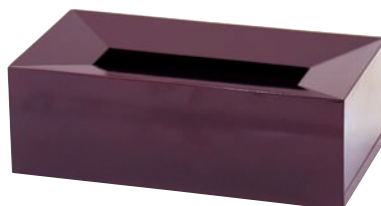
JJ ティッシュボックス 溜塗 16-431-07 (50640) 9,150円 約26.5×14×H9cm