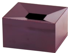
JJ ハーフティッシュボックス 溜塗 16-431-06 (50641) 7,800円 約15×13.4×H6.7cm