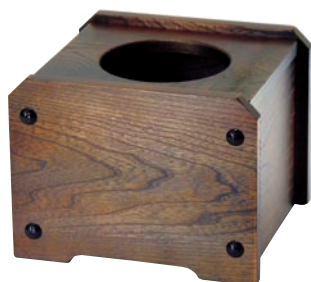
SI くず箱 小 元禄 16-431-03 (50649) 7,880円 約19.5×18×H15cm