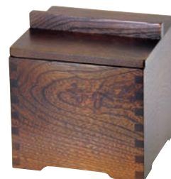
SI サニタリーボックス 元禄 16-431-05 (50651) 4,500円 約15×15×H15.8cm