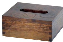
SI ハーフティッシュボックス 元禄 16-431-01 (50648) 4,400円 約17.5×14.8×H7.5cm