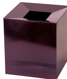
JJ くず箱 溜塗 16-431-08 (50642) 10,300円 約17.8×17.8×H20.2cm