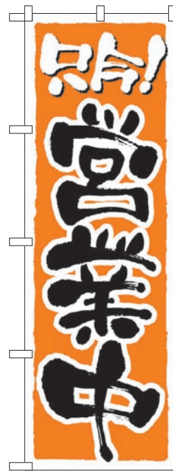
のぼり 只今営業中 16-460-03 (56857) 4,200円 約60×180cm ※素材：ポリエステル