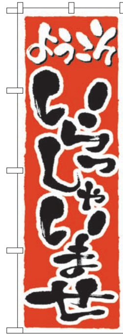
のぼり ようこそいらっしゃいませ 16-460-10 (56859) 4,200円 約60×180cm ※素材：ポリエステル