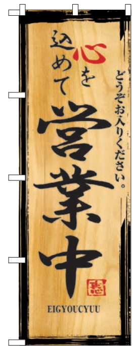
のぼり 心を入れて営業中 16-460-04 (56858) 4,200円 約60×180cm ※素材：ポリエステル