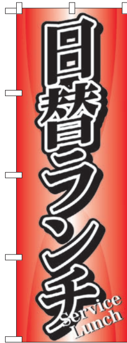
のぼり 日替ランチ 16-460-09 (56856) 3,900円 約60×180cm ※素材：ポリエステル