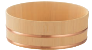
榧・浅型湯桶 (鋼タガ)