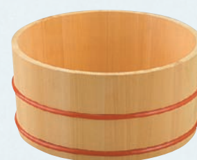
榧・湯桶 (ポリウレタン樹脂タガ)