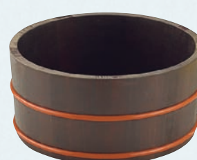
榧・摺漆湯桶 (ポリウレタン樹脂タガ)