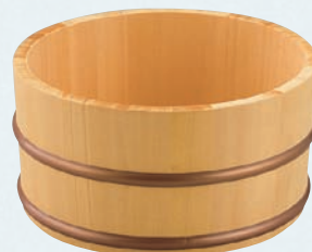
榧・湯桶 (ポリプロピレン樹脂タガ)