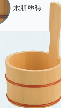
榧・片手湯桶 (ポリウレタン樹脂タガ)

16-462-14 (30156) 5,900円 約φ14.3×H23.8(10.3)cm