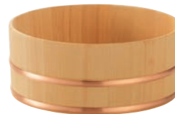
榧・ミニ湯桶 (鋼タガ)