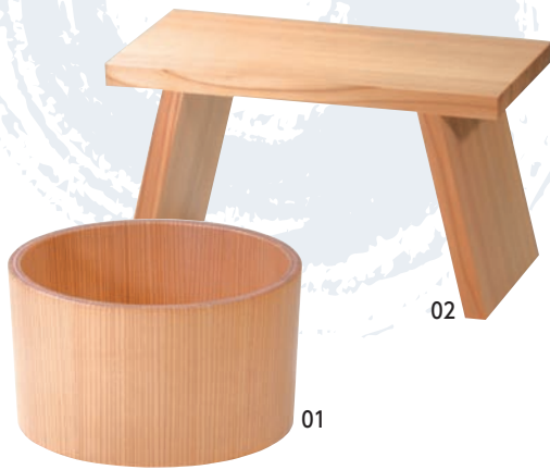
日光杉・SD 湯桶 シャープ