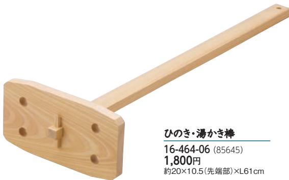
ひのき・湯かき棒