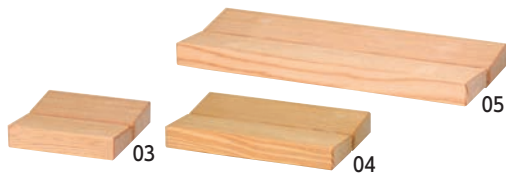
日光杉・SD ソープレスト

16-464-03 (50704) S 1,030円 約8.9×8.2×H2cm