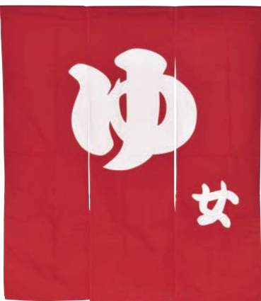
ゆのれん 3連 赤(女)

16-467-09 (51505) 19,250円 約W120×H140cm ※綿100% ※型染め