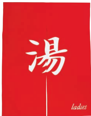
新タイプゆのれん 染め抜き 赤(女性)

16-467-02 (59316) 16,500円 約W85×H90cm ※綿100% ※防災加工品