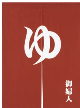
ゆのれん えんじ(御婦人)

16-467-04 (56918) 16,500円 約W90×H120cm ※綿100%