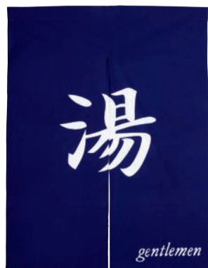
新タイプゆのれん 染め抜き 青(男性)

16-467-03 (56917) 16,500円 約W90×H120cm ※綿100%