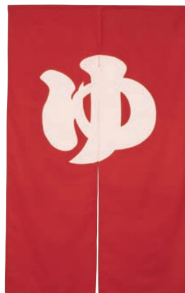
ゆのれん 型染め(赤)

16-467-10 (51504) 19,250円 約W120×H140cm ※綿100% ※型染め