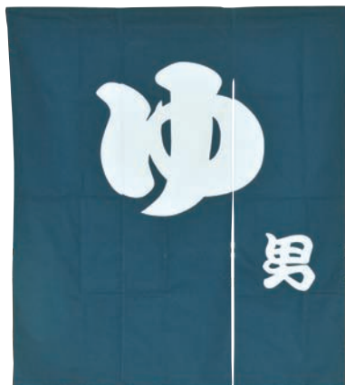
ゆのれん 3連 青(男)

16-467-09 (51505) 19,250円 約W120×H140cm ※綿100% ※型染め