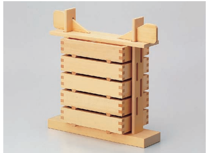
白木・押寿司器 (5段セット)