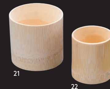
磨き竹筒 (無塗装) 16-091-21 (22562) 大 370円 約φ7.5~8×H7cm