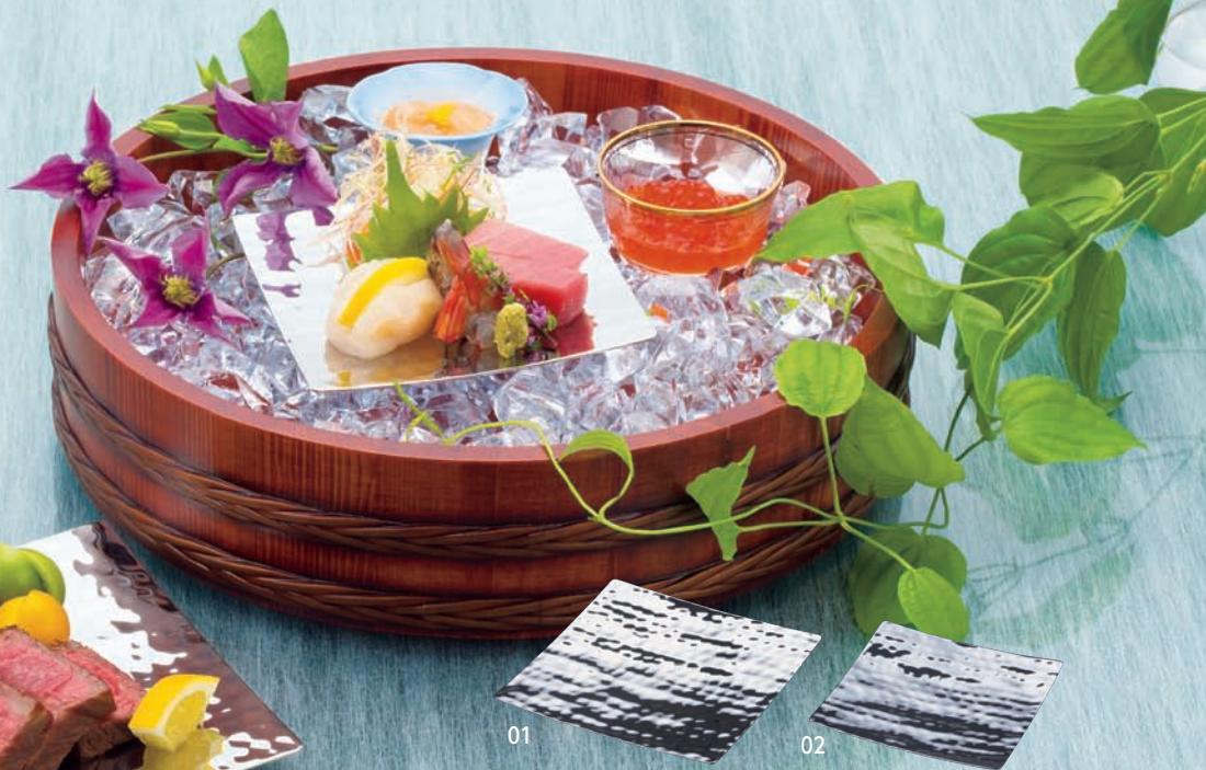
ステンレス樋目 四方皿 16-099-01 (24827) 5寸 8,800円 約15×15×H1.4cm 16-099-02 (24826) 4寸 6,800円 約12×12×H1.2cm ※リング足付