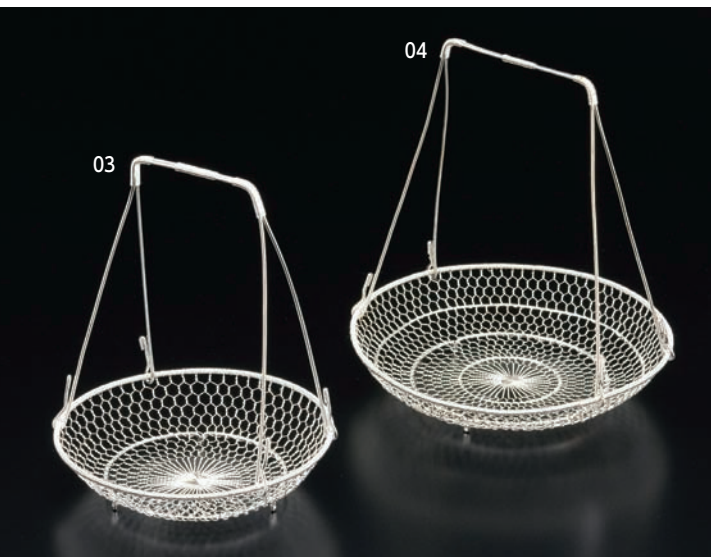
手提籠 シルバー 16-099-03 (24414) 小 5,400円 約φ13.5×H17(3.1)cm 16-099-04 (24413) 大 6,300円 約φ17×H18.5(3.5)cm