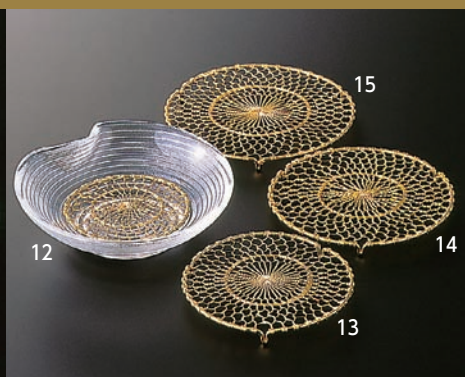
ステンレス目皿 16-099-05 (24820) 3寸 800円 約φ9×H1.2cm 16-099-06 (24821) 3.5寸 850円 約φ10.5×H1.2cm 16-099-07 (24822) 4寸 1,000円 約φ11.5×H1.2cm