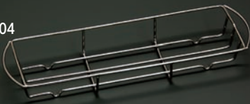
珍味・薬味入ワイヤーラック