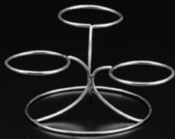
小付三種リングベース