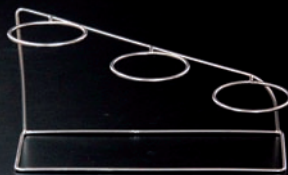
ステップリングベース