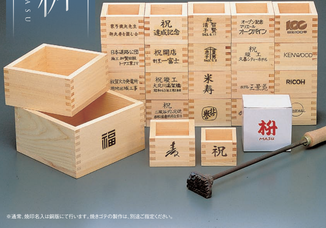
※通常、焼印名入は銅版にて行います。焼きゴテの製作は、別途ご指定ください。