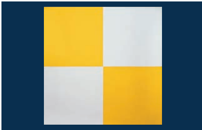
市松懐敷 金銀(200枚入)

16-258-03 (25266) 3寸 2,000円 (1枚当り10円) 約9×9cm