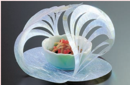
オーロラマリモ(100枚入)

16-258-13 (26128) 小 7,200円 (1枚当り72円) 約9.3×7.2×H6.5cm