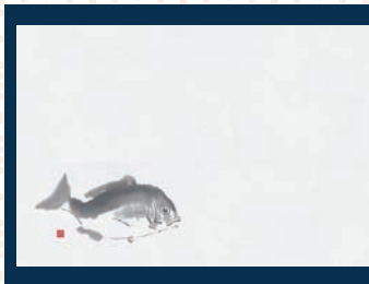
16-277-01 (64857) たい(鯛)