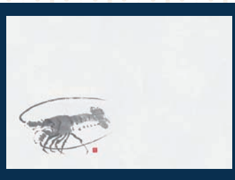
16-277-02 (64858) えび(海老)