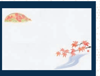
16-277-13 (64967) 赤もみじ(10月~11月)