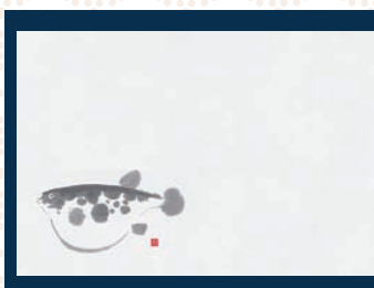
16-277-07 (64862) ふぐ(河豚)