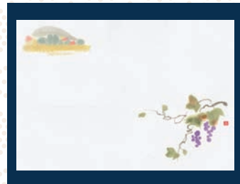
16-277-12 (64966) 山ぶどう(9月~10月)