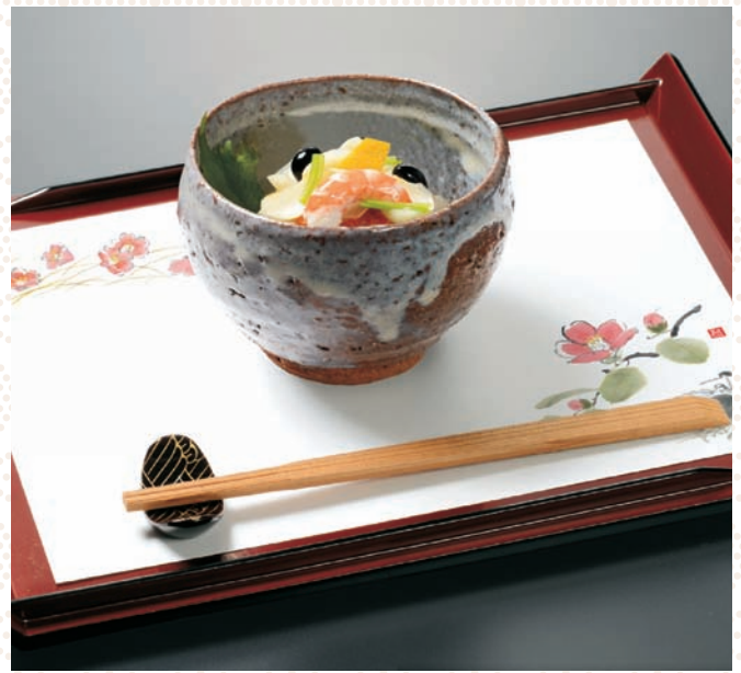
[無蛍光紙] お手元まっと