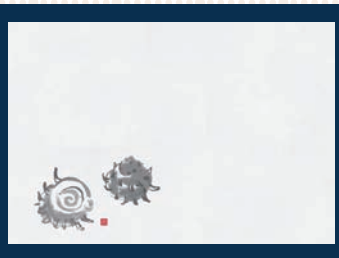
16-277-04 (64860) さざえ(榮螺)