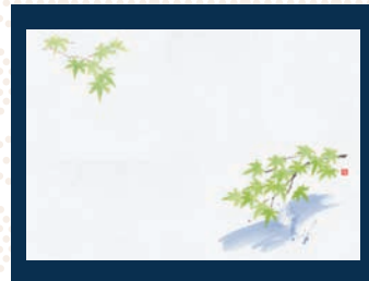
16-277-10 (64963) 青もみじ(4月~8月)