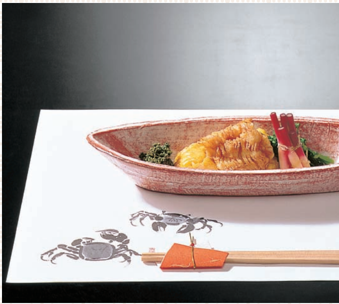
[無蛍光紙] 四季彩まっと