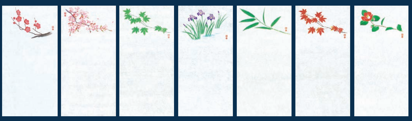
16-320-01 (65808) 梅(1月～3月)