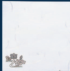
4寸 雲竜敷紙 はす (100枚入)

17-267-08 (65287) 900円 約12×12cm (1枚当り9円) ◆無蛍光雲竜和紙を使用しております。