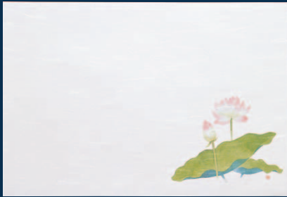
尺3 枯淡懐石まっと はす (100枚入)

17-267-03 (65052) 3,500円 約26.4×39cm (1枚当り35円)