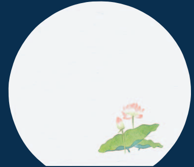
尺3半月 枯淡懐石まっと はす (100枚入)

17-267-04 (64718) 2,000円 約26.4×39cm (1枚当り40円)