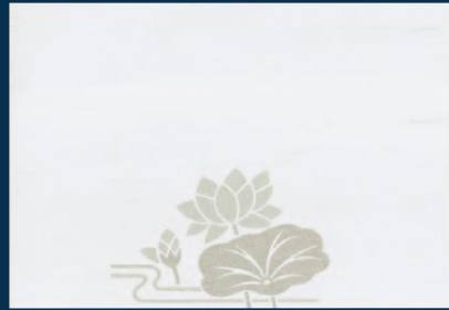
尺3 風雅懐石まっと はす (50枚入)

17-267-03 (65052) 3,500円 約26.4×39cm (1枚当り35円)