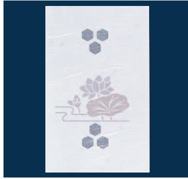
ドーム掛紙 はす (100枚入)

17-267-01 (64498) 5,000円 約17.8×29cm (1枚当り50円) ◆無蛍光雲竜和紙を使用しております。