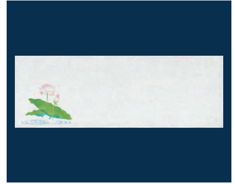
お料理四季紙 はす (100枚入)

17-267-02 (64995) 2,000円 約13.5×39cm (1枚当り20円) ◆無蛍光雲竜和紙を使用しております。