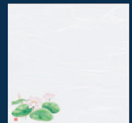
4寸 四季彩雲竜敷紙 はす (100枚入)

17-267-08 (65287) 900円 約12×12cm (1枚当り9円) ◆無蛍光雲竜和紙を使用しております。