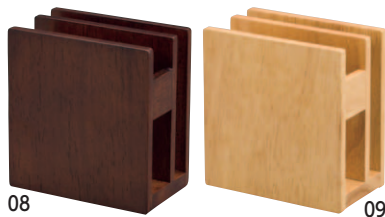
SC 木製ナプキン&メニュースタンド