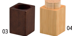
SC 木製ピックスタンド