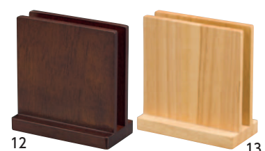
SC 木製メニュースタンド